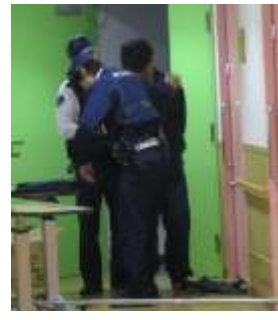
不審者を確保しました。警察官は頼もしいです。