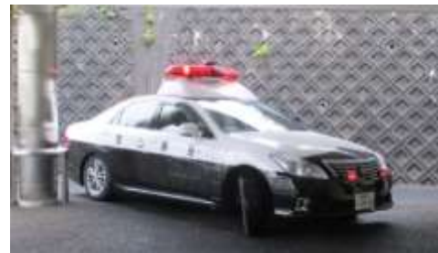
実際に通報してパトカーを呼びました。