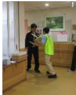
応戦中：一人ではかないませんね・・・