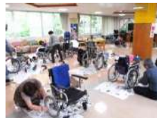
■清掃ボランティア