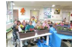
■金光小学校との交流会