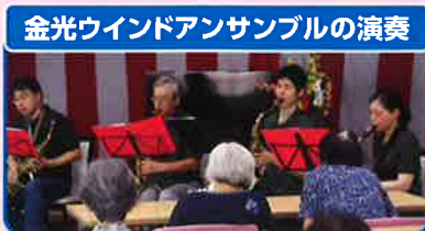
金光ウインドアンサンブルの演奏