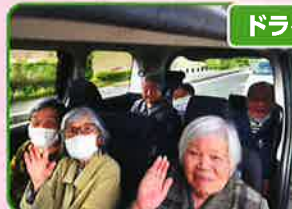
ドライブはええなあ〜