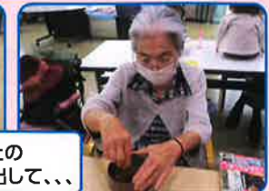
昔習ったのを思い出して、...