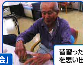
毎週土曜日は「おたのしみ会」