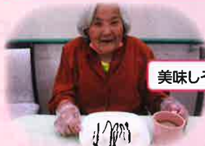
美味しそうでしょう〜