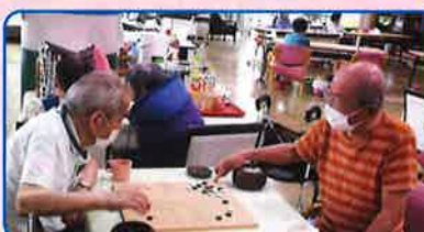
ボランティアさんと囲碁を楽しんでいます