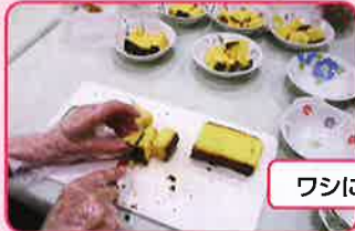
ワシにまかしとけ!