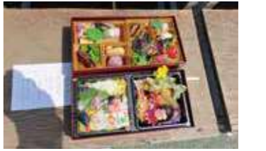
13名が参加(どちらも1人欠けています笑) お弁当(鳥取砂丘で食事)