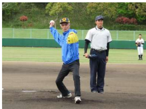
山部幹事始球式（どんぐり球場）

決勝戦は、肌寒かったです、試合は、熱の入った良い試合でした。皆様、応援お疲れ様でした。