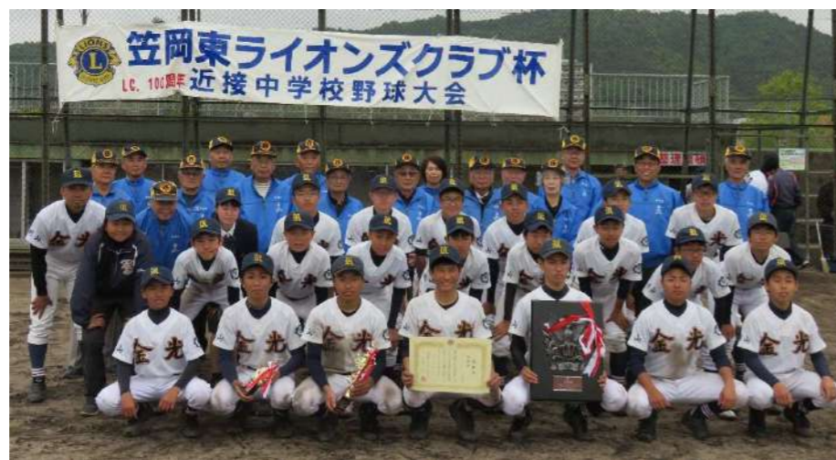
準優勝 金光学園中学校

決勝戦は、肌寒かったです、試合は、熱の入った良い試合でした。皆様、応援お疲れ様でした。