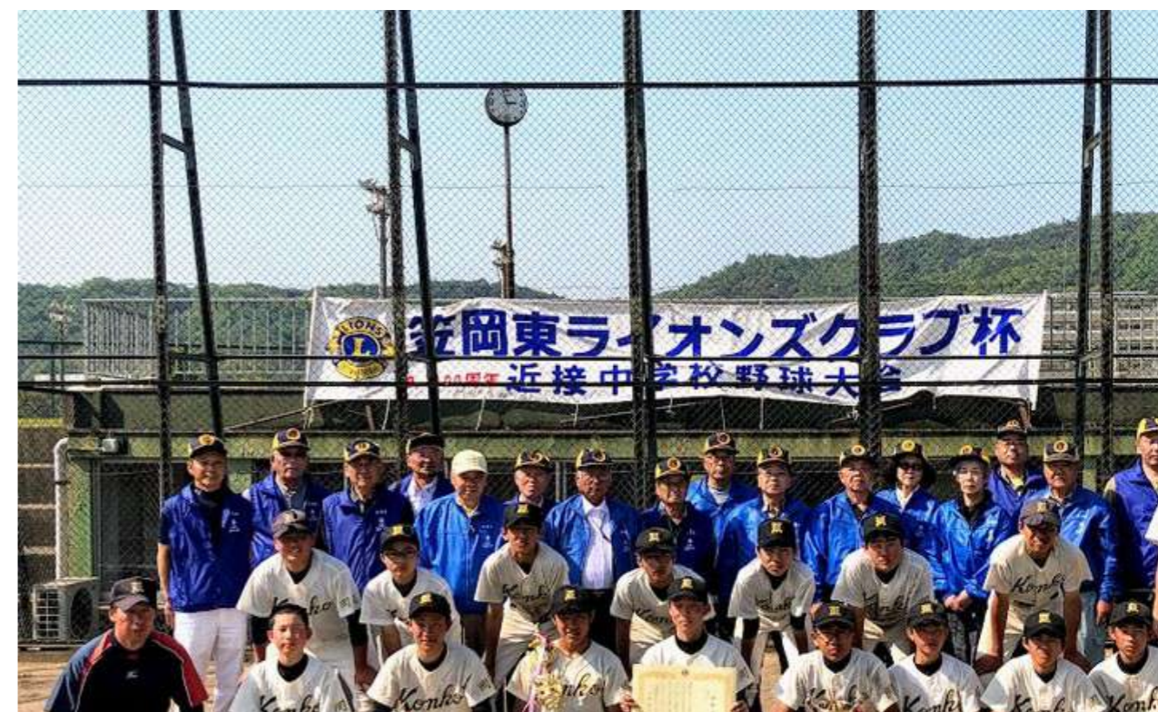
第13回笠岡東ライオンズクラブ杯近接中学校野球大会 初優勝：金光中学校