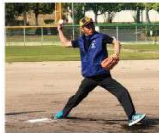
東川会長始球式(笠岡市営球)