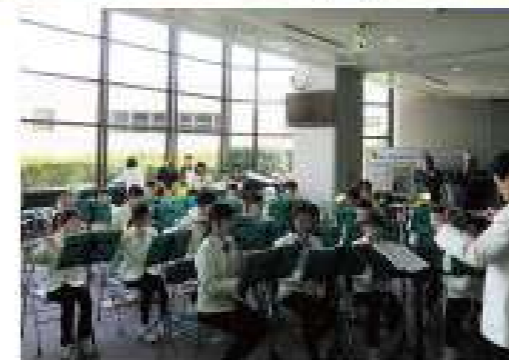
SKYM ジュニアウインドアンサンブルによる歓迎演奏