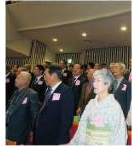
笠岡東ライオンズクラブ