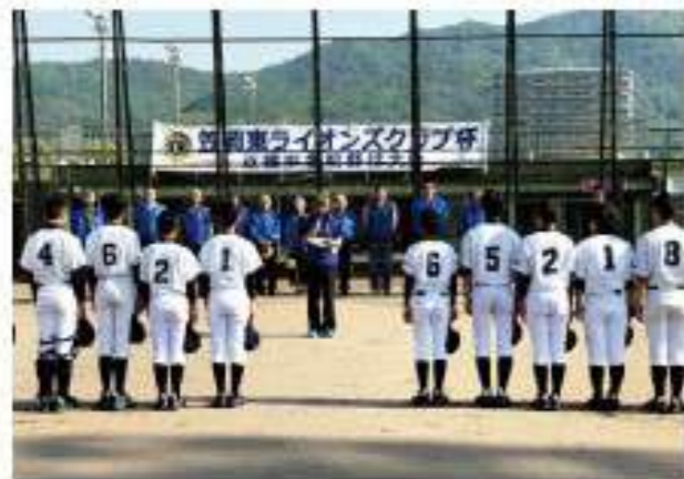
開会式8時15分 会長挨拶

中学校生徒に野球競技実践の機会を与え、技能向上とアマチュア・スポーツ高揚をはかり心身共に健康な生徒の相互親睦を図るものです。