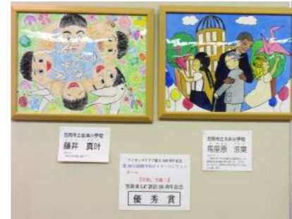
最優秀賞の作品は構図が特にすばらしい。