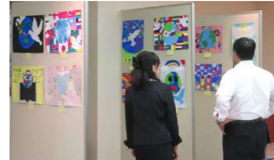
クラブ審査会の様子 9月16日(水) 於：笠岡グランドホテル