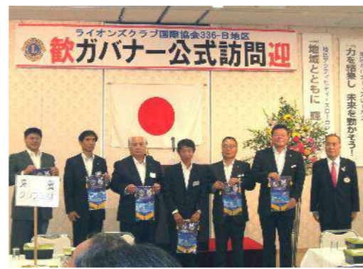
バナー贈呈 6クラブ会長へ