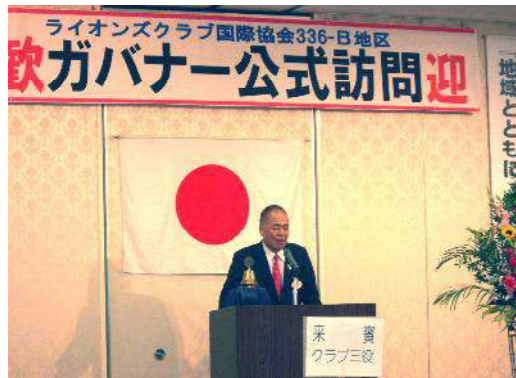
336-B地区 地区ガバナー尾崎博挨拶