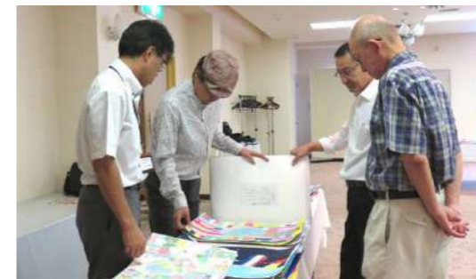
最終審査会の様子 9月17日(木) 於：笠岡グランドホテル